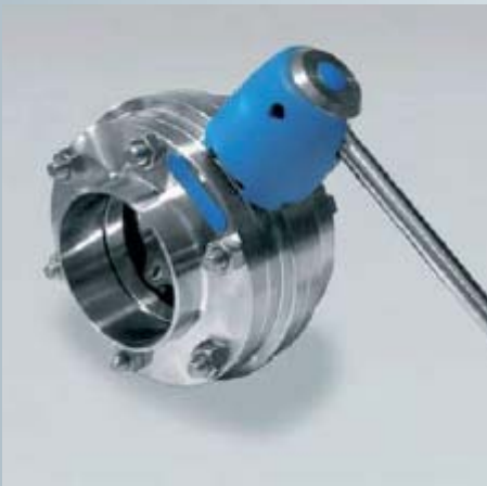
Abbildung wie oben