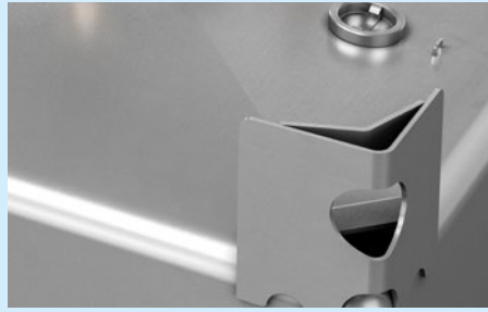
Stapelecken und Krantransportösen